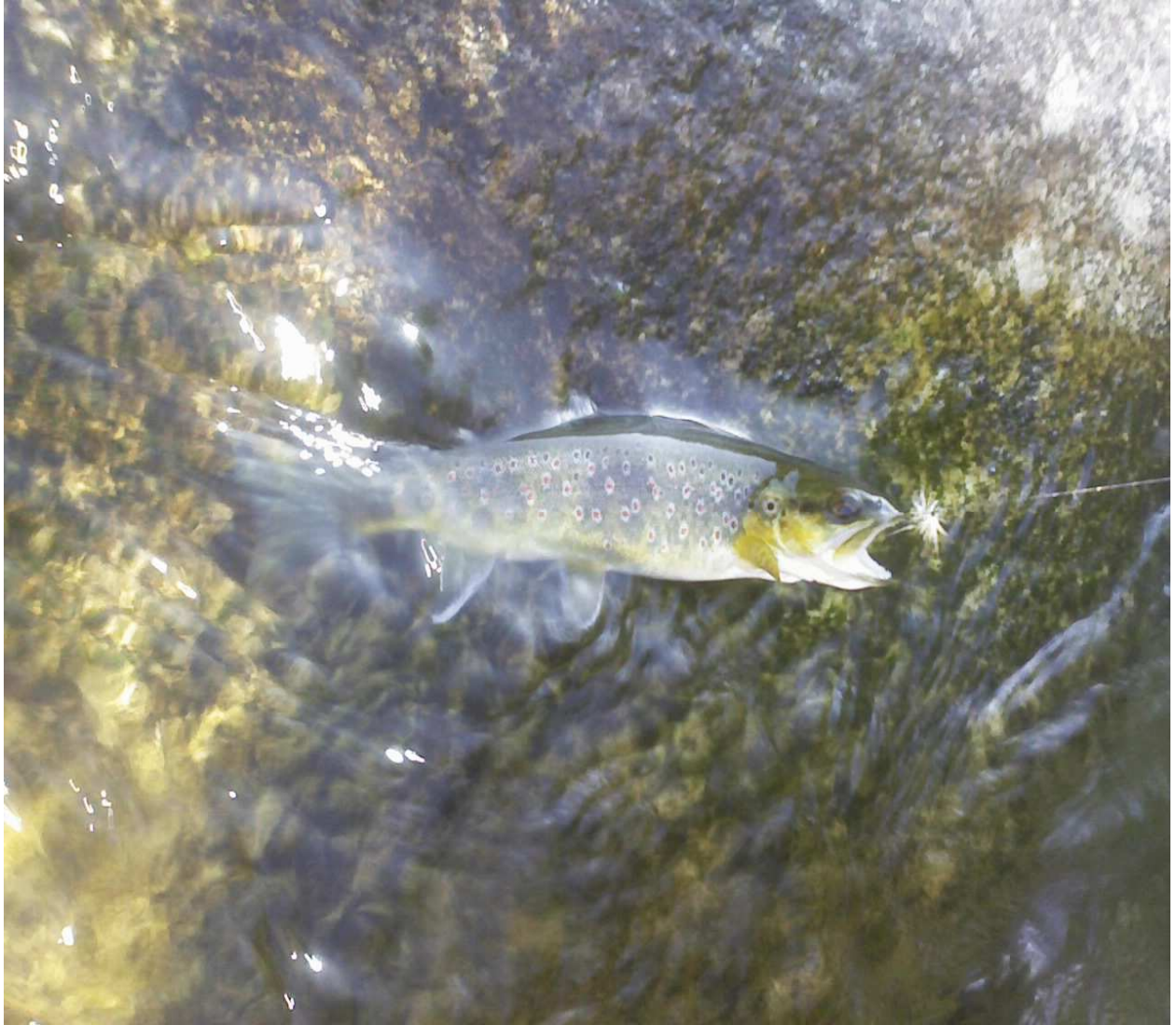
Une belle de la Borne

Du fait de la régulation thermique et hydraulique opéré par le barrage, la pêche à la mouche peut s'avérer ici fructueuse dès l'ouverture. Le profil de ces secteurs, se prête bien à toutes les techniques de la Truite en eaux vives, mais aussi à toutes celles de la PALM, la pêche en sèche dans ces successions de bloc aux postes bien marqués est de loin la plus ludique et la plus agréable à pratiquer.