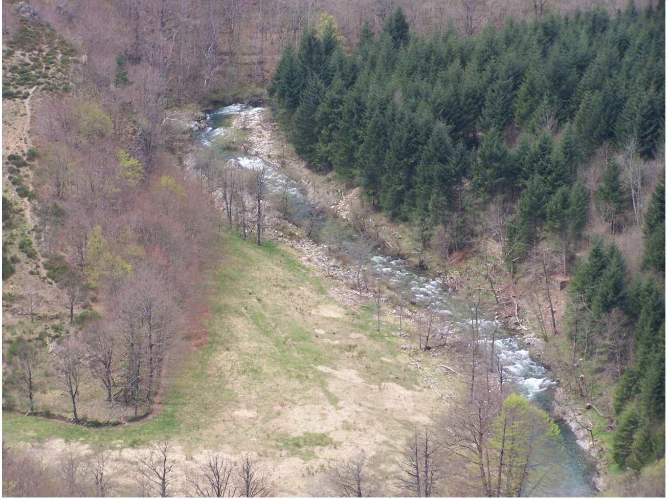
La Borne sous le camping de St Laurent les Bains

La borne petite rivière cévenole de 40 KM de long, prend sa source sur la montagne Ardéchoise à 1400mt d'alt, au col de la Croix de Bauzon sur la commune de Mayres.