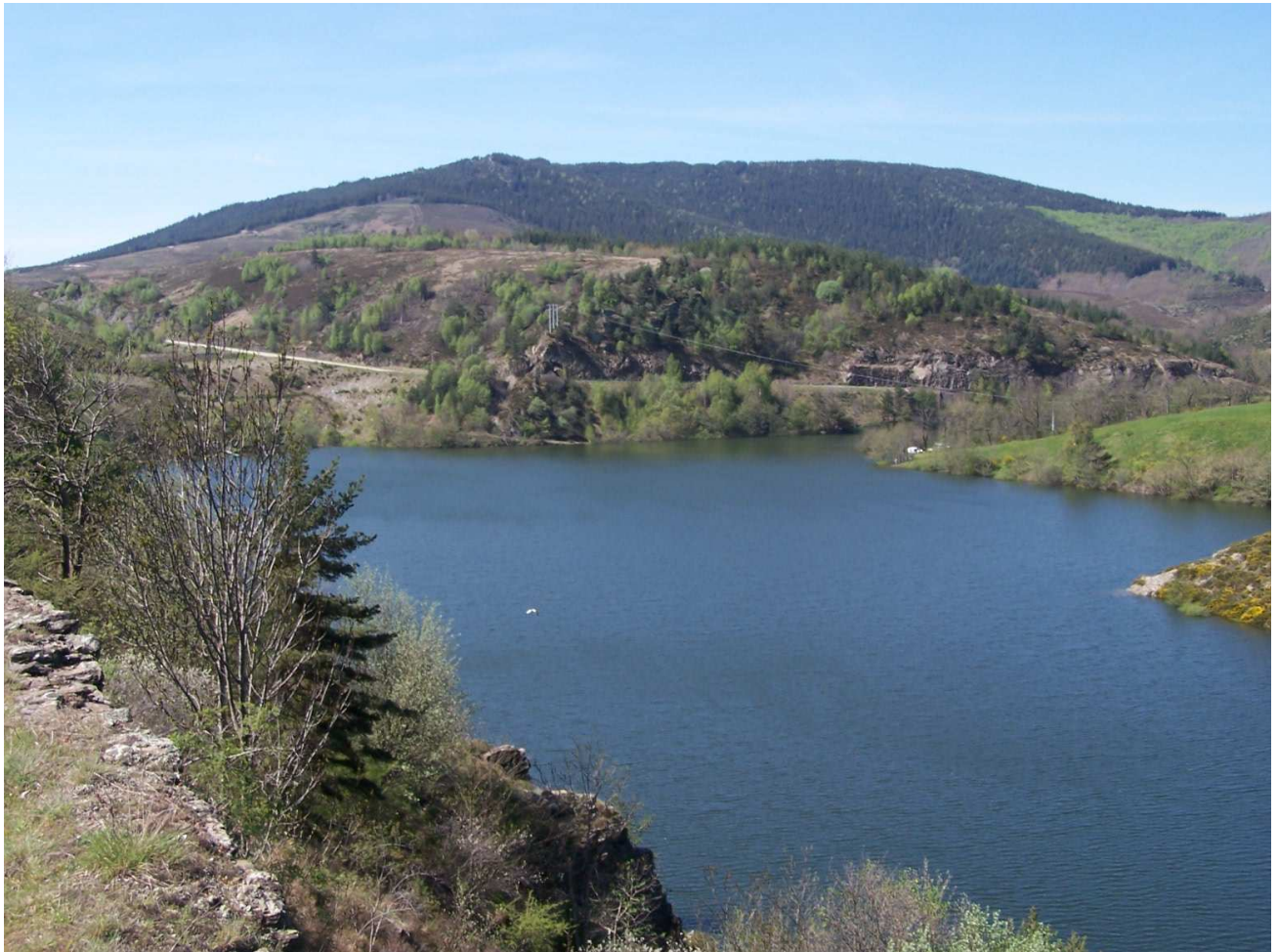
Barrage du Rachas à Prévenchères

Le chassezac et ses eaux limpides coulent là sur un lit de galet, au milieu de nombreux blocs de granit, dans une alternance de courant vif, gours profonds, radier et pool plus lent. Les Truites de taille modeste (16 à 25 cm) se prennent bien en sèche (à parti de mi-avril, début mai), au Toc en début de saison et à l'ultra léger.