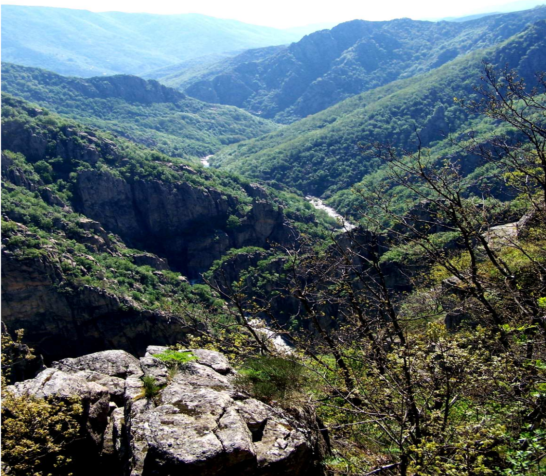
La vallée du chassezac vue de la Garde-Guérin

Les parcours que je vous propose de découvrir, débutent à l'aval du petit village de Prévenchères (48) sous la retenue EDF « du Rachas », et vont jusqu'au barrage de St Marguerite-Lafigère (07) et Pied de Borne (48).