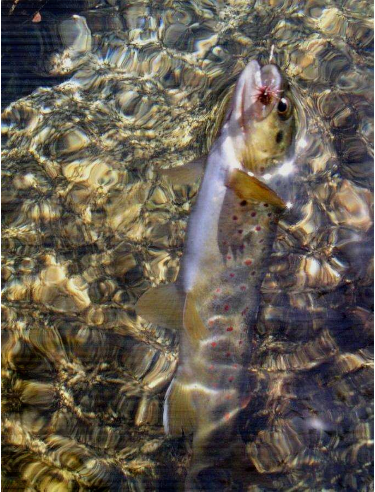
Belle des eaux vives et petit sedge roux