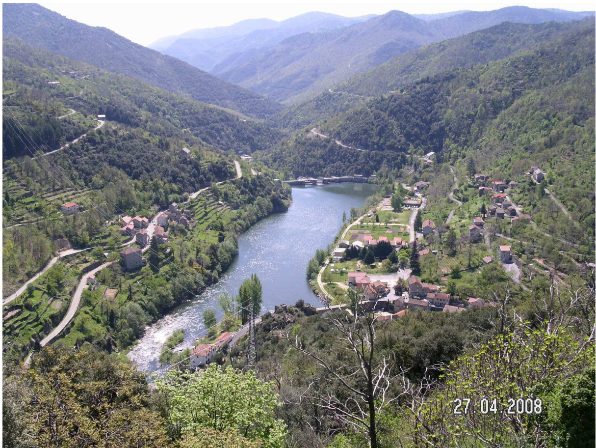
Confluence de l'Altier, de la Borne et du Chassezac à St Magerite 07 en rive gauche et Pied de Borne 48 en rive droite

A la sortie du parcours de canyoning et jusqu'à sa confluence avec l'Altier au niveau de Pied de Borne, le Chassezac offre à nouveau des parcours de grande qualité halieutique aux pêcheurs sportifs. Des parcours au fond de gorges profondes d'une minérale beauté, ou s'enchaîne courant vif et gours immenses. La pêche au Toc et au vairon y est possible dès l'ouverture, pour la mouche il sera préférable d'attendre début mai.